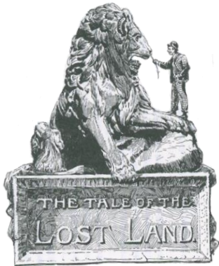
『アーサー王宮廷のコネチカット・ヤンキー』 ダニエル・カーター・ピアドによる挿絵

少年・少女時代、『トム・ソーヤーの冒険』のトムやハックの活躍に、胸躍らせた方も多いのではないのでしょうか？