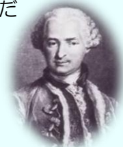
この顔にピンときたら参考郷土室へ

もしかしたら今も、タイム・トラベルを続け、あなたの直ぐ傍にいるのかもしれないね…。