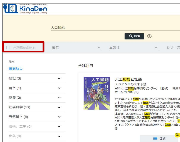
所蔵タイトルのみ